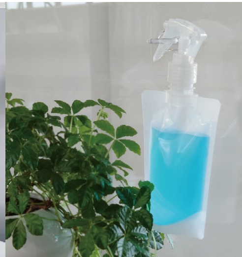
スプレーのトリガー部分を 掛けて収納