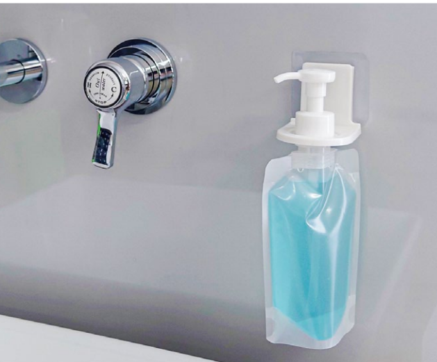
壁面にフック等を付けて 浮かせる収納

物品を床に置いていると埃が溜まったり、水回りではカビの温床になる場合がありますが、浮かせる収納では風通しよく清潔に、そしてパウチの薄さによる省スペース収納が可能です。