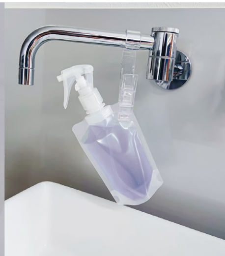
パウチ部分を挟んで 浮かせる収納